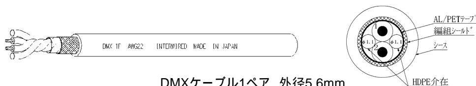
DMXケーブル1ペア 外径5.6mm