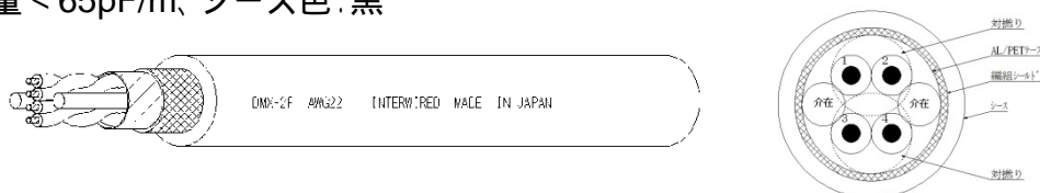
DMXケーブル2ペア 外径7.6mm

導体22AWG、アルミマイラ + 編組シールド、架橋ポリエチレン絶縁、容量 < 65pF/m、シース色: 黒